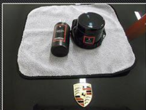
Utilisation de produits haut de gamme

Passion detailing 77 est un centre de soin automobile ou plusieurs formules vous sont proposées, du nettoyage avec application d'une cire de protection afin de faciliter l'entretien de votre véhicule à la rénovation complète de celui ci, réfection des vernis, rénovation des optiques, traitement des chromes, nettoyage et protection des vinyles extérieurs et cuirs, traitement des rayures profondes, protection carrosserie par la pose de cires de protection haute gamme.