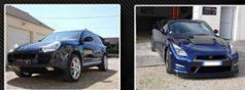
Tout type de véhicules