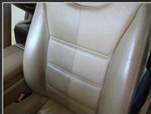
Nettoyage et protection des cuirs